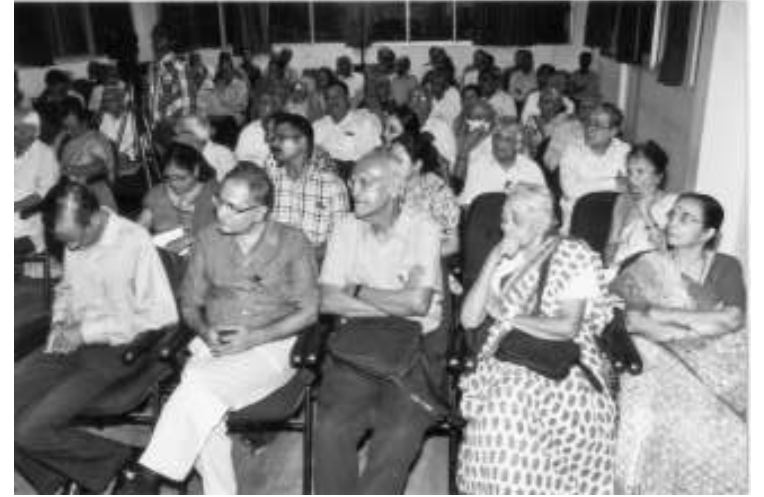
પરિષદના કાર્યક્રમમાં શ્રોતાગણ

આગામી ફેબ્રુઆરી માસમાં 'માતૃભાષા દિન' નિમિત્તે શાળા-કોલેજોમાં વિવિધ કાર્યક્રમો કરવાનું આયોજન છે.